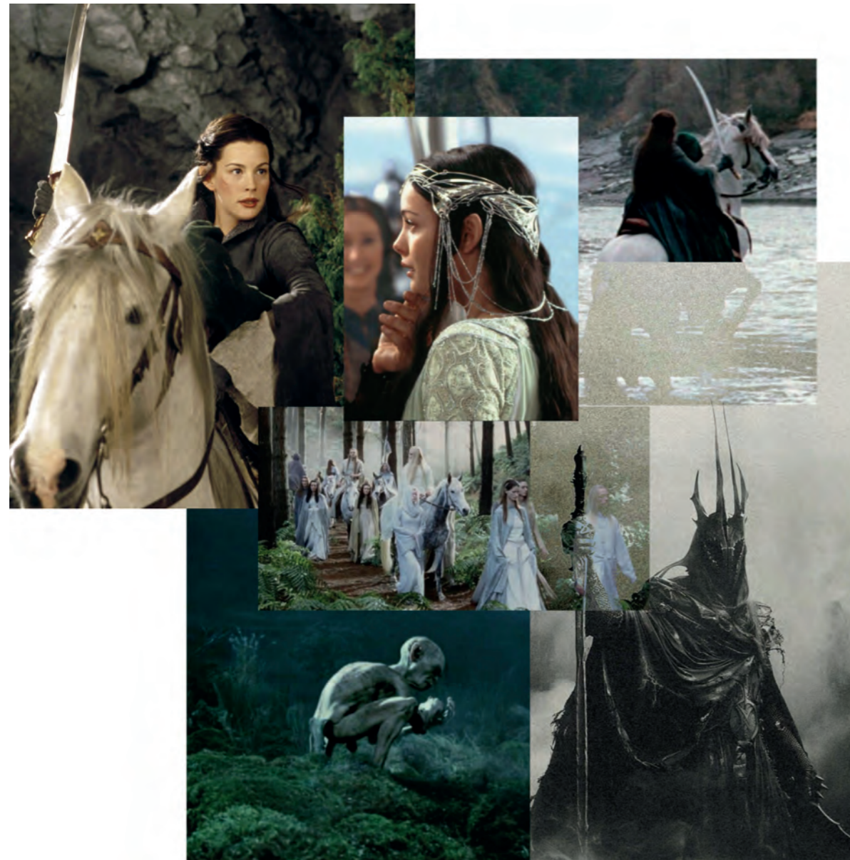
Faszination für „Darkness“ und Dark Aesthetic / Fantasy

lord of the rings, hobbit, dune, dark souls